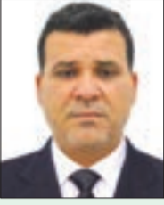
■ أ.د/ قدور محمد أستاذ التاريخ الحديث والمعاصر - عميد كلية العلوم الإنسانية - جامعة الجزائر 2

● (قراءة في وثيقة أرشيفية شهادة امرأة تونسية في رسالتها إلى صديقتها الجزائرية 11 مارس 1958)