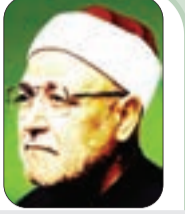
الشيخ: محمد الغزالي - رحمه الله -