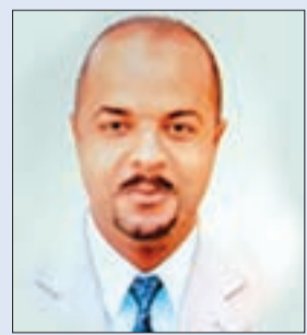
بقلم: د. د. عمر العربي، جامعة بشار

أسعد نفسك بالقرآن وقل الحمد لله الذي أنزل الفرقان.. أغلق كل متطلبات السعادة الموهومة، والبعيدة، والمظنون حصولها، والمؤقتة، والسعادة التي يكثر عليها التنافس والزحام، وادخل باب السعادة الحقة والثابتة والدائمة والباركة والخاصة والمقدور عليها، وذلك مع مصحفك؛ ارفعه إليك رفح المتلهف على تحصيله، والواثق بعظيم بركته، والموقن بجزيل العطاء الذي لا حدود له معه.