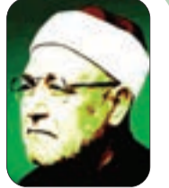
الشيخ: محمد الغزالي - رحمه الله -

((وَالنَّازِعَاتُ غَرْقًا وَالنَّاشِطَاتُ نَشْطًا وَالشَّابِحَاتُ سَبْحًا فَالسَّابِقَاتُ سَبْقًا فَالْمُدَبِّرَاتُ أَمْرًا)).. الذي اختاره: أن هذه الأقسام بالكواكب الدوّارة في الفضاء، تشق طريقها بغير وقود، وتسرع السير بغير توقّف، وتعرف الطريق بغير جندي مرور، ثم يجيئها أجلها مع نهاية العالم، فإذا هي تتلاشى! متى؟ (يَوْمَ تَرْجُفُ الرَّجِفَةُ * تَتْبَعُهَا الرَّادِفَةُ))، في الزلزال الكبير الذي يُفقد كل شيء توازنه، وتترادف مزعجاته فإذا القلوب مضطربة والأبصار كسيرة!