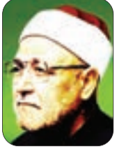
■ الشيخ: محمد الغزالي - رحمه الله -