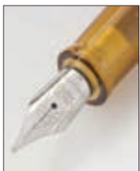
بقلم: شويدر عبد الحليم

تعد التنمية المستدامة من القضايا الرئيسية التي تواجه المجتمعات في القرن الواحد والعشرين، إذ تسعى الأمم إلى تحقيق نمو اقتصادي واجتماعي يبيّن ضمن تلبية احتياجات الأجيال الحالية من دون الإضرار بقدرتها الأجيال القادمة على تلبية احتياجاتها.