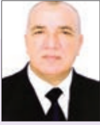
بقلم: مباركية نوار

إن سؤال: ما موقع المتعلم في عملية إصلاح المناهج؟ هو سؤال خليق بالمناوشة وحقيق بالمنازلة، ولو لهنيئات قصار، من طرف كل من يتجشم تعب التصدي لعملية إصلاح المناهج التعليمية، إن في خطواتها التنظيرية أو في مرحلتها البنائية الإجرائية. وهذا السؤال المعتبر مستقداً من تفكيرك سؤال آخر أكبر منه، ونازل من رحمه، وهو: متى يُسمع صوت المتعلم؟