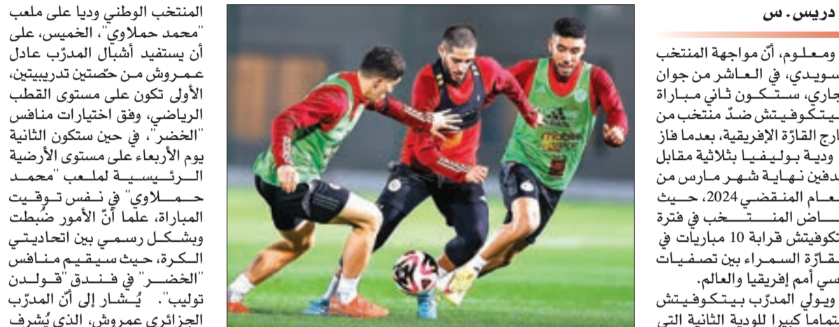
دريس ـ س

قالت مصادر "الشروق"، إنّ مدرب المنتخب الوطني، فلاديمير بيتكوفيتش، عقب التنسيق مع الاتحاد الجزائري لكرة القدم، قرّر، بشكل رسمي، تغيير مقر إقامة المنتخب في قسنطينة، من الفندق العسكري إلى فندق "الماريوت"، وذلك لقضاء ليلة الأربعاء إلى الخميس، علماً أنّ زلاء من سبعتيني سيحلون بمدينة قسنطينة صبيحة الأربعاء، ويستقيدون من حوض حضة تدريبيهة على "محمد حملاوي"، قبل العودة مجدداً إلى العاصمة لمواصلة التحضيرات في مركز تحضيرات المنتخب الوطنية في سيدي موسى، وبعدها السفر يوم 8 من الشهر الحالي إلى العاصمة السويديّة "ستوكهولم" لمواجهة المنتخب المحلي يوم 10 على ملعب "ستر أويبيري أرينا".