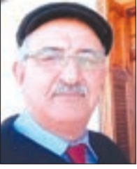
بقلم الدكتور محمد أرزقي فزاد

تحدثنا في الحلقة الأولى عن مشاركتي في الدروس الرمضانية التي تنظمها زاوية تماسين التجانية كل سنة، تحت عنوان "معارج السالكين". وذكرت نبذة تاريخية موجزة للطريقة التجانية ومؤسسها أحمد التجاني، وخليفته سيد الحاج علي التماسيني، وذكرت أيضا قائمة الخلفاء.