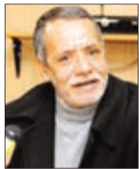
بقلم: التهامي مجوري

مما أكرم الله به الأئمة الخطباء في المجتمعات الإسلامية، فرصة مخاطبة الجماهير الواسعة بمعتقداتهم، أمرنا بالمعروف ونهيا عن المنكر ودعوة إلى الله، وإمامة الناس في الصلاة، حيث مكّنهم من مخاطبة هذه الجماهير مرة كل أسبوع على الأقل في خطب الجمعة، وهي فرصة لم تتح لغيرهم من الناس؛ بل هي فرصة وأية فرصة، مدة عشرين دقيقة والإمام يتكلم ويوجه ويأمر وينهى ويثني ويحتج ويغضب ويرضى... ولا أحد يقدر على أن يقول له لا أو لماذا قلت؟ أو يجتج أو يعقب أو يعترض. على رأي رآه... وهي فرصة لم تتح لرؤساء الجمهوريات ولا للملوك ولا لغيرهم!!