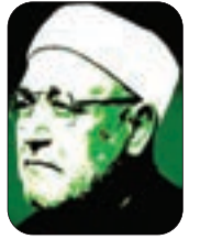
■ الشيخ: محمد الغزالي - رحمه الله -