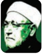
■ الشيخ: محمد الغزالي -رحمه الله-