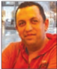
بقلم: إسماعيل جمعه الرياوي

في ظل الجرائم الصهيونية في غزة، والتي فاقت كل التصور، ومن سلوك أمريكا والدول الأخرى الداعمة لإسرائيل سرا وعلنا، هناك حقيقة مؤلمة، على العرب إدراكها من أجل مستقبلهم ومستقبل أجيالهم.