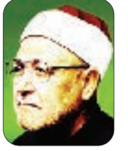
■ الشيخ: محمد الغزالي - رحمه الله -