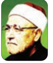
■ الشيخ: محمد الغزالي - رحمه الله -