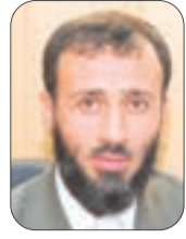
● بقلم: سلطان بركاني

ليس الشاب المسلم وحده هو من يجب عليه أن يبني زواجه على أساس متين من الدين؛ الفتاة المسلمة من جهتها أيضا، ينبغي أن تجعل في خلدتها دائما أن الزواج قرينة وطاعة وأنه مصلحة دينية قبل أن يكون مصلحة دنيوية، وأن عليها أن تنتهي له بإصلاح نفسها والإقبال على مولايها وخالقها ليقبض لها زوجا صالحا صاحب خلق ودين، تسعد بصحبته في الدنيا والآخرة.