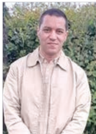
نابع من الشارع نفسه.

تصدير الأزمة نحو الخارج، وعلى رأسه الجزائر، لم يعد ينطلي على أحد، وهو دليل على الإفلاس السياسي للنظام المخزني، الذي لا يملك أي مشروع داخلي جامع، ولا رؤية مستقبلية إلا الحفاظ على عرشه بأي ثمن.