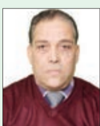
■ بقلم: أ. د محمد بوالروايح

كرر رئيس وزراء الكيان بنيامين نتنياهو تمسكه بشروطه لوقف الحرب في غزة التي قال إنه بلغها للوفد الإسرائيلي المفاوض المتوجه إلى الدوحة، والتي تتمثل في إعادة الأسرى وتفكيك حماس ونزع سلاحها ورفض إدارة قطاع غزة بعد الحرب من قبل أي فصيل فلسطيني من حماس أو من السلطة الفلسطينية، وهذا يعني أن نتنياهو يريد شروطا على المقاس، تحقّق له على طاولة المفاوضات ما عجز عن تحقيقه في ساحة العمليات.