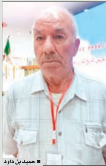
حميد بن داود

من أجله غيرهم، وأن يجعلوا من أفكارهم قوة إيجابية للنهوض ببلدهم وجعلها في مصاف الدول المتقدمة. للإشارة، فإن ندوة "الصين - الجزائر تكريس التاريخ الثوري وتعزيز المستقبل المشترك" حضرها وزير المجاهدين وذوي الحقوق السيد العيد ربيقة والسفير دونغ قوانغلي وبعض المجاهدين، بحيث تم تبادل النقاش حول مسيرة الصين والجزائر النضالية من أجل الاستقلال والقواسم المشتركة الروحية، وكيفية التعاون في ظل التحولات العالمية للحفاظ على السلام والاستقرار، وكما شهدت هذه الفعالية معرضاً لصور وثائق تاريخ الصداقة الصينية الجزائرية.