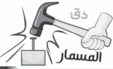
■ بقلم، طاهر حيسى