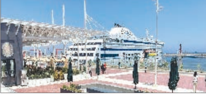
ق.م / واج