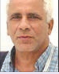
بقلم: أبو بكر خالد سعد الله

طالما مثل رؤساء تحرير المجالات الأكاديمية الركيزة الأساسية في النظام الجامعي عبر العالم، فهم موظفون إداريون وعلميون أو صياع على جودة مضامين مجلاتهم وضامنون لأخلاقيات النشر العلمي. ورغم أنهم يعملون في الظل، فإن أثرهم ينعكس على جميع مناحي الحياة الجامعية، من تقييم الأداء الأكاديمي للباحثين، إلى ترسيخ مصداقية المؤسسة وخدمة سمعتها. ومع ذلك، فإن ما يعانيه من ضغط وإرهاق غالباً ما يظل طي النسيان لا يبالي به أحد.