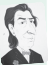
■ بقلم: طاهر حليسي