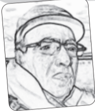
■ أعمار يزي

عين الخرج الأخرى: محفظة عبارة عن شكاره كتان استعملها مثل "صاك أدو" اليوم، لنقلها، ولو أن ثقلها ليس هو ثقل اليوم. إنما كنا نأخذ كل كتينا وأدواتنا كلها يومياً، لا ندري ماذا يطلب منا.. خاصة والمدرسة بعيدة.