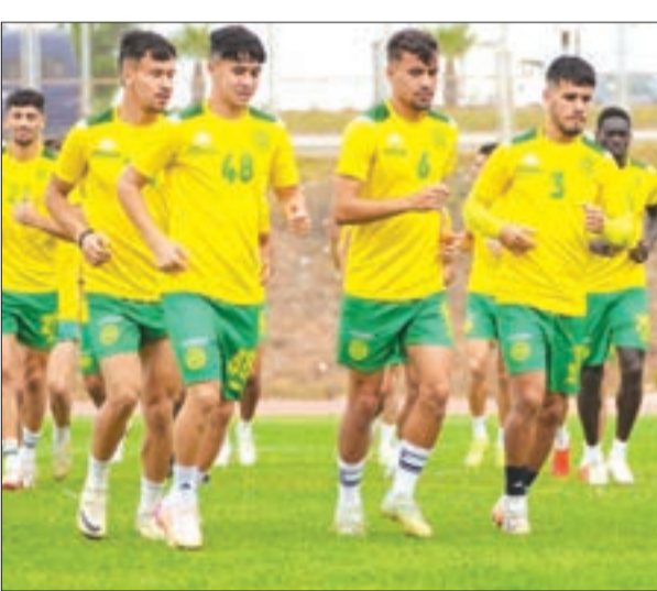
دريس ـ س

وعدت إدارة شبيبة القبائل، ممثلة في رئيس مجلس الإدارة الهادي ولد علي بصرف منحة معتبرة على اللاعبين في حال تجاوز الدور التمهيدي الأول من رابطة أبطال إفريقيا، من خلال تجاوز عقبة نادي بيبباني غولد ستارس الغاني السبت المقبل في إطار لقاء الذهاب، حيث تحرص إدارة ويتوصيات من "موبيليس" وضع اللاعبين في أفضل الظروف من أجل دفعهم لتحقيق "الديكليك" على المستوى القاري عقب فشل الفريق في الزياطة المحترفة الأولى "موبيليس"، بعد خوض ثلاث مباريات منذ انطلاق الموسم الكروي الحالي.