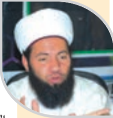
● حجيمي: خطر الهلوسة المعرفية في نماذج الذكاء الاصطناعي قد تأتي بمحتوى غير صحيح

وقال إنه ينبغي أخذ كل الأساليب التي من خلالها نستطيع توقيف مثل هذه التطورات التكنولوجية عندما تجعل المجتمع في تضرر كبير، أي عندما تقلد أصوات التجويد لأموات وأحياء وتنسب إلى الغير، أو عندما الاصطناعي لتقليد أسلوب القرآن أو محاكاة نصوص مشابهة بشكل قد يخل بالتمييز بين كلام الله وفعل بشري.