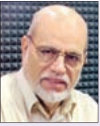
بقلم: أبو جرة سلطاني رئيس المنتدى العالمي للوسطية

أبرز عوامل انتصار ثورة التحرير الجزائرية المباركة 54 / 62 ثلاثة: • وحدة القيادة • ووضوح الهدف • وسلاح المقاومة. وهي العوامل التي كانت الثورة الفلسطينية تفتقر إليها، فكانت عجيبة ناتجها و"تفرغه" وحقد فريقه على المدنيين والأطفال والنساء.. سببا في تحقيق عاملين من هذه العوامل الثلاثة أضافهما لحساب المقاومة من حيث لا يحتسب: