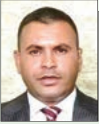
■ سيف الدين قداش

تأتي مقاربتنا التالية استكمالاً لما سبق أن طرحناه من أفكار تتعلق بالتأسيس لمستقبل الجمهورية وفق رؤية تحقق للبلاد أهدافها الكبرى مع حلول مئوية الاستقلال، وقد ارتأينا في الفصل الثالث من هذه الرؤية التركيز على الغايات الكبرى والشاملة المتصلة بالأسس الجوهرية التي تُمكن الجزائر من ضمان استقرارها واستمرارها.