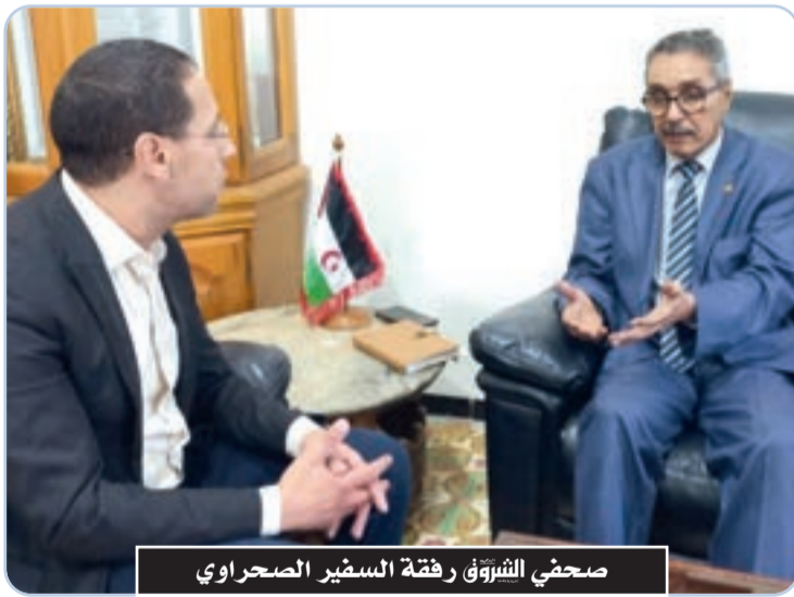
صحفي الشروق رفقة السفير الصحراوي

○ ○ كنّا دائماً مستعدون للحوار والنقاش خاصة إذا ظل في إطار الأمم المتحدة لأنها المسؤولة عنه باعتبار قضية