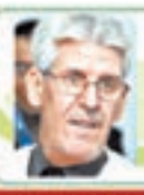
ب. ق. و