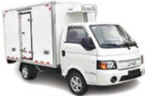
BOSSEUR S/ C FRIGO