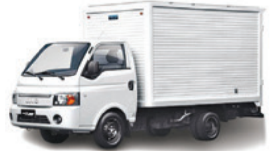
BOSSEUR S/ C CONTENEUR