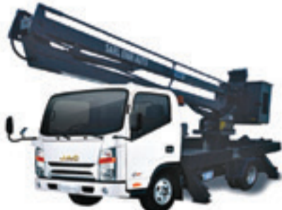
1040 S PLATEFORME NACELLE