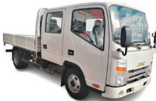
1040 S D/C PLATEAU