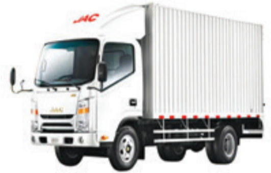
1040 S CONTENEUR