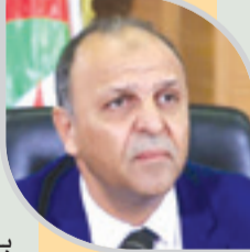
محمد خوجة: الملحمة الصباحية غير الصحية أكبر ضرر للتلاميذ