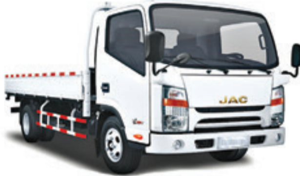
1040 S S/C PLATEAU