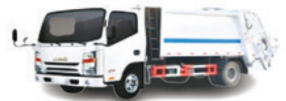
1040 S BENNE TASSEUSE