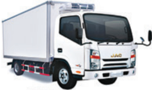
1040 S CELLULE FRIGO