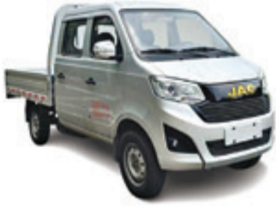
X 50 D/C PLATEAU