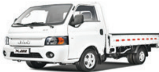
BOSSEUR S/C PLATEAU