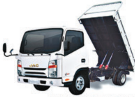
1040 S BENNE BASCULANTE