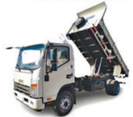
OMAN BENNE BASCULANTE