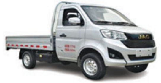
X 50 S/C PLATEAU