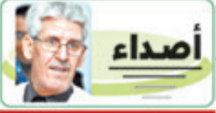
بقلم: أ. محمد الهادي الحسني