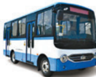
JAC BUS URBAIN 44 PLACES