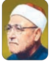
■ الشيخ: محمد الغزالي - رحمه الله -