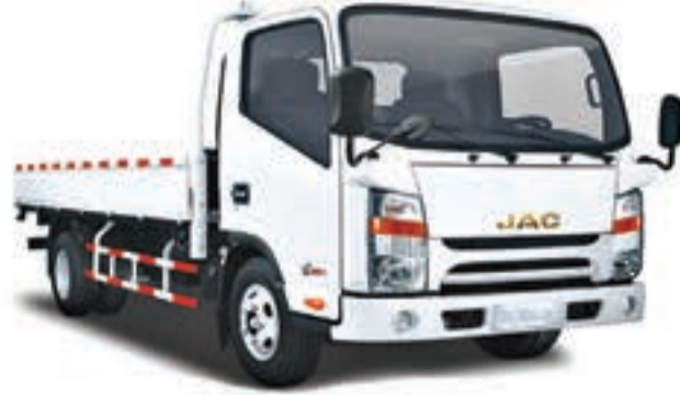
1040 S S/C PLATEAU