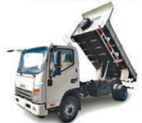
OMAN BENNE BASCULANTE