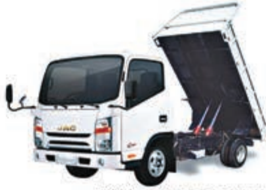
1040 S BENNE BASCULANTE