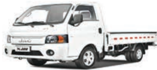
BOSSEUR S/C PLATEAU