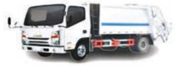
1040 S BENNE TASSEUSE