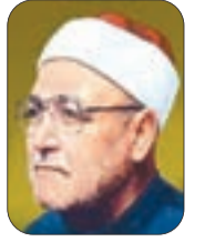
الشيخ: محمد الغزالي - رحمه الله -