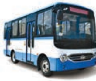
JAC BUS URBAIN 44 PLACES