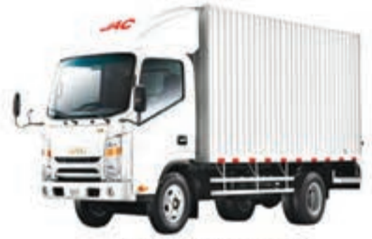
1040 S CONTENEUR