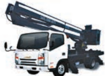
1040 S PLATEFORME NACELLE