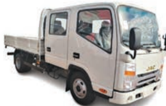
1040 S D/C PLATEAU