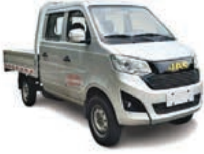
X 50 D/C PLATEAU