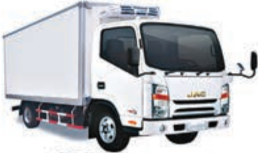
1040 S CELLULE FRIGO