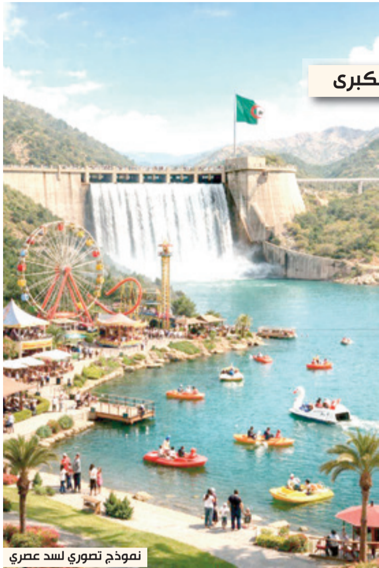
نموذج تصويري لسد عصري