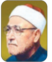
الشيخ محمد الغزالي - رحمه الله -