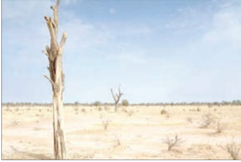
إعداد دراسة تقنية حول التكيف مع التغيرات المناخية

شكل ملف القضاء على ظاهرة التصحر، محور تدخلات أعضاء المجلس الشعبي لولاية سيدي بلعباس، في دورته الرابعة المنعقدة مؤخرًا، بقاعة المداولات بمقر الولاية، بسبب استفحال هذه الظاهرة، بعد أن أصبح زحف الرمال، يهدد الغطاء الغابي بالمناطق الجنوبية، في ظل فشل حملات التشجير المنظمة دوريًا، بسبب غياب المتابعة بحسب ما أجمع عليه الأعضاء المنتخبون ضمن تدخلاتهم.