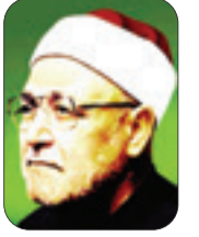
الشيخ: محمد الغزالي - رحمه الله -