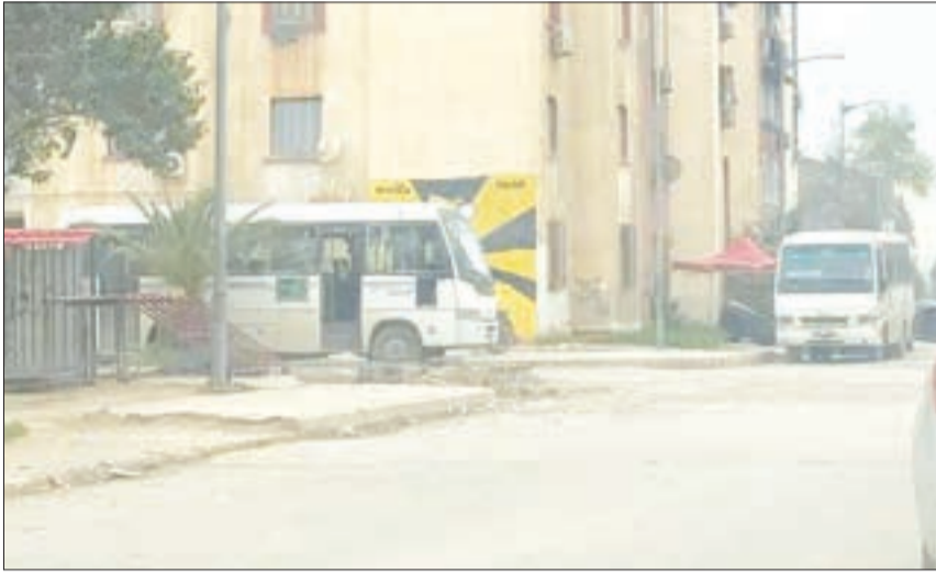
مريم - ز

تواصل معاناة سكان بن طلحة ببلدية براق في العاصمة، منذ أزيد من شهر، بسبب الغياب شبه التام للحافلات والنقل العمومي عن معظم الأحياء بها، وذلك في ظل تدهور حالة الطرقات واستمرار سقوط الأمطار، وهو ما انعكس سلبا على تنقلات المواطنين وعلى رأسهم التلاميذ والعمال.