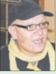
بقلم : د. عثمان عبد اللو

لا يبالغ الخبراء حين يصفون صناعة الحديد والصلب، بأنها العمود الفقري للاقتصادات الحديثة. هي ليست مجرد صناعة ثقيلة، بل هي المعيار الذي يُقاس به مدى التقدم الصناعي والقوة الاقتصادية لأي دولة.