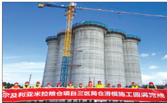
وُلفت المتحدثة، إلى أن الأشغال الجارية، معنية بإتمام عملية صب القوالب المنزلة إلى قمة الصوامع، إذ يعتبر - حسبها - أول مشروع من ضمن 30 صومعة المسجل إنجازها على مستوى التراب الوطني، متقدمة.

يُكمل بها صب القوالب المنزلة إلى غاية القمة. ومعلوم أن صوامع التخزين، أصبحت اليوم من المشاريع الرائدة في القطاع الفلاحي الذي يعرف ديناميكية متسارعة، تجسيدا لتعليمات رئيس الجمهورية عبد المجيد تبون، بوضع استراتيجية وطنية على المدى القريب، لمباشرة مخطط مهيك لتحويل الإنتاج الذاتي في المحاصيل الاستراتيجية وفي مقدمتها الذرة والشعير والقمح الصلب مع استعادة زراعة الذرة كأولوية وجعلها تقليدا في الثقافة الزراعية الجزائرية، لخفض ميزانية الاستيراد التي لطالما أنهكت خزينة الدولة لسنوات.