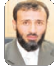
● سلطان بركاني

أيام معدودة بقيت تفضلنا عن حلول رمضان، هذا الشهر الذي كان في قرون مضت وعقود سلفت شهراً لتخليص النفوس من عيوبها وآفاتنا وكفها عن غوائلها وشهواتها، شهراً للرحمة والتأزر والتعاون؛ يحس فيه الأغنياء والموسرون بمعاناة الفقراء والاحتاجين، فيمدون الأيدي بالصدقات والأعطيات.. لكن الواقع تغير في السنوات الأخيرة، حين أصبح رمضان في حياة كثير من المسلمين شهراً للموائد المليئة والأطباق المتنوعة، وموسماً للإسراف والتبذير ومضاعفة المصاريف، والانكفاء على رغبات النفس عن حاجات الآخرين.