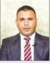
بقلم: سيف الدين قداش

لا أسعى هنا إلى ادعاء امتلاك الحقيقة، ولا إلى الدفاع عن فكرة بدافع شخصي أو سياسي، بقدر ما أحاول مقارنة الموضوع بقدر من التجرد والمسؤولية الفكرية. فكثيرا ما نجد أنفسنا مضطرين إلى إعادة النظر في قناعاتنا عندما تواجهنا الحقيقة بوضوحها الصارم ونقاها الحاد، سواء جاء ذلك مبكرا أم متأخرا، إذ تظل الحقيقة في النهاية عصبية على الإخفاء أو الانتفاف.