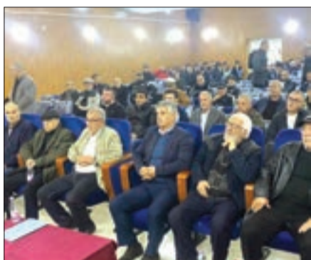
أعضاء الجمعية العامة لاتحاد الحراش