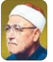
■ الشيخ محمد الغزالي - رحمه الله -