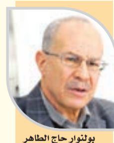
بولنوار حاج الطاهر

وقال إن العقلانية في الشراء، تبدأ من تدوين الاحتياجات في ورقة، لأن الإفراط في