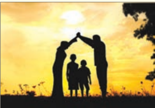
(د. عبد الكريم بكار)

الناظر في مجالس "ما قبل الزواج" يلحظ جدلا علميا جافا يتركز حول المهر، وقائمة الشروط، وتفصيل الأثاث، بدقة تضاهي صياغة العقود التجارية الكبرى؛ وهذا الاستغراق في التفاصيل المادية بعمق يفوق مناقشة التوافق الفكري والروحي، يعكس خللا في ترتيب الأولويات؛ فنحن نؤمن "الجدران" بأبهي الحلّي، ولكننا نغفل عن تأمين "النفس" التي ستسكن داخل تلك الجدران.. إننا ننسى أن الأثاث الفاخر لا يمكنه أن يملأ فراغا أحدثه غياب التفاهم، ولا يمكنه أن يجبر كسر روح لا تلتقي مع شريكها في فكرة أو حلم.