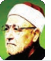
الشيخ محمد الغزالي - رحمه الله -