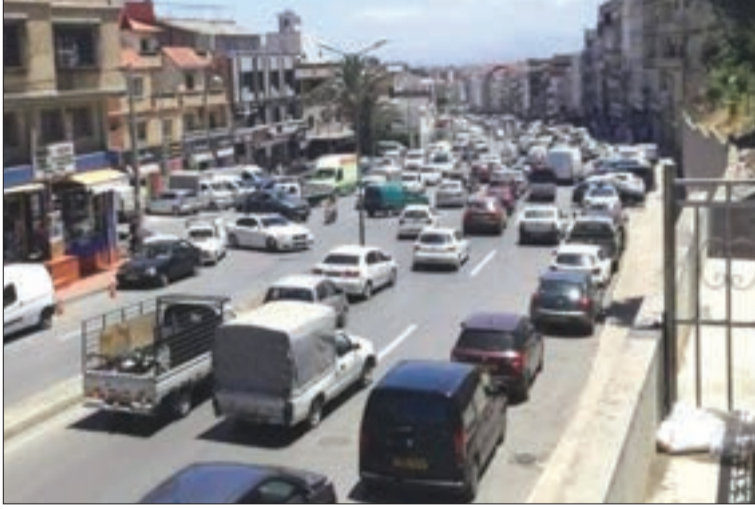
اللهفة تناطح الوفرة

تشهد منطقة المنظر الجميل ببلدية القبة، المعروفة بالانتشار الكبير لمحلات بيع المواد الغذائية بالجملة، توافدا كبيرا للمواطنين والزبائن لاقتناء مستلزمات الشهر الفضيل، حيث أضحي المرور بالطريق الذي يفرق المحلات بالجانبيين عشية حلول المناسبة مزدحما، نتيجة الركن العشوائي للمركبات والذي يصل إلى رواقين في كثير من الحالات، حيث يضطر أصحابها إلى وضعها بشكل غير منظم في ظل غياب حواجز الركن بالموقع الذي يزداد التوافد عليه مع اقتراب المناسبات، فيما تعج المحلات هذه الأيام بعدد كبير من الزبائن لسد طلباتهم من المواد الغذائية التي تعرف وفرة واضحة.