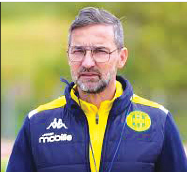
دريس ـ س

قالت مصادر "الشروق": إنّ مدرب شبيبة القبائل، الألماني جوزيف زينباور، يرفض المواصلة على رأس العارضة الشّنيّة، عقب محاولات الاعتداء التي تعرّض لها في تنزانيا، بعد الخسارة في آخر جولة من دور مجموعات رابطة أبطال إفريقيا، ضدّ نادي يانغ أفريكانز المحلي بتلاشية نظيفة