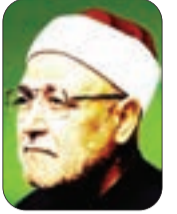
الشيخ محمد الغزالي - رحمه الله -