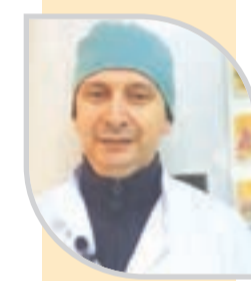
● بواب ضياء الدين

وعجزت أخرى، مصابة بجفاف الكلوية، ورغم تأكيد طبيها على ضرورة الإفطار نهارا، وشرب كميات كبيرة من المياه، وإلا