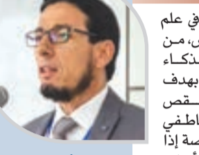
● بوشكوية: استشارة "شات جي بي تي" في قضايا العنف الأسري، هو بحث عن السرية والخصوصية

ويرى أن أدوات الذكاء الاصطناعي مثل "شات جي بي تي"، يمكن أن تلعب دوراً مكملًا، من خلال تقديم معلومات أولية وإرشادات عامة، لكنها لا تستطيع