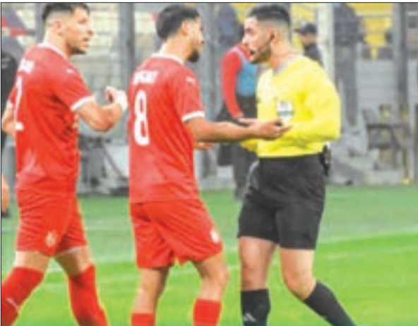
دريس ـ س

قالت مصادر "الشروق"، إن قلب دفاع شباب بلوزداد شُعب كداد، يتجه نحو تضييع مواجهة ذهاب ريع نهائي كأس الأتحاد الإفريقي ضدّ النادي المصري، في المباراة المقررة بين الناديين السبت القادم على ملعب "السويس الجديد".