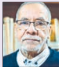
● بقلم: الهادي مجوري

عندما قرأت واستمعت لبعض الآراء والمواقف من الشامتين والمنشقين في مقتل المرشد الأعلى الإيراني علي خمينائي، تذكرت مبالغات ومواقف المسلمين من بعضهم البعض ومن مخالفيهم في قليل أو في كثير من الأمور، وتذكرت أيضاً ما قلته لبعضهم من المختلفين من المسلمين في المذاهب والآراء والمواقف ولا زلت، "إذا لم تستطيعوا أن تكونوا مسلمين في تعاملكم مع بعضكم البعض، فكونوا رجالاً!" لأن الرجولة والفحولة في المنطلق العربي الإسلامي من مشتقات مكارم الأخلاق التي استصحابها الإسلام في منظومته الأخلاقية "... الناس معادن، خيأهم في الجاهلية خيأهم في الإسلام، إذا فقّوا، تجردون من خير الناس..." [أخرجه البخاري ومسلم عن أبي هريرة].