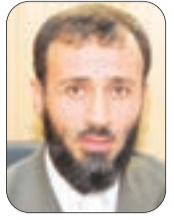
يقلم: سلطان بركاني

لم تعد تفصلنا عن العشر الأواخر من رمضان سوى ساعات معدودة، وهي -في ميزان من يطلب الخير لنفسه- ساعات حاسمة في الاستعداد والتهيؤ... ونحن لو كنا ندرك قدر العشر الأواخر من رمضان، لرحمنا هم الاستعداد لها في أيام وليالي العام كلها، كيف لا وهي عشر الرجاء والعطاء؟ لكن على أضعف الإيمان، يفترض أن تكون الساعات الأخيرة التي تسبقها مضامرنا للاستعداد.