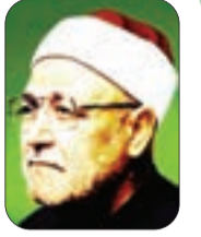
الشيخ محمد الغزالي - رحمه الله -