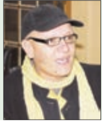
● بقلم: د. عثمان عبد اللوش

بالرغم من أن الوكالة الدولية للطاقة الذرية كانت تؤكد التزام إيران تقنياً بنود الاتفاق المبرم مع الولايات المتحدة في عهد الرئيس باراك أوباما في 2015. إلا أن الرئيس ترامب في 2018، اعتبر الاتفاق من أساسه «معيبا وهيكليا فاشلا»، لذا قرّر الانسحاب الأحادي من «خطة العمل الشاملة المشتركة»، والمعروفة بالاتفاق النووي الإيراني.