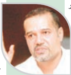
● زيدي: "حذاء صحي مائة بالمائة" خدعة تجارية لرفع السعر

وحذر البروفيسور إسماعيل غادي، من انتشار الترويج لأحذية عادية على أنها طبية وصحية، بهدف بيعها بأسعار باهظة أو جلب الزبائن إليها، موضعا أن هناك فرقا شاسعا بين تلك الصحية وتلك التي تبدو مريحة، مشيرا إلى أن الأحذية الطبية لديها علامة وترخيص يؤكد أنها مناسبة خاصة لمرضى السكري والذين يعانون مشاكل في العظام والقدمين. وتتميز الأحذية الصحية بحسبه، بدم أفضل للقدم وتقليل الضغط على المفاصل في أثناء المشي، وتحتوي نعلا مرنا مبطنا، ودعم لقوس القدم، ومساحة مريحة للأصابع، ومواد تسمح بنهوية