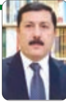
■ شيروان الشميراني

تلاسن" بينه وبين النائب المسلمة "إلهان عمر" خلال لقائه خطاب حالة الاتحاد في 20-2-2026؛ حيث اتهمت إلهان عمر ترمب بأن تحريضه الدائب على الكراهية يقف وراء تعرضها للهجوم بمادة سائلة من أحد الأشخاص في 17-1-2026. والأمر الثاني: ما حدث من مذابح وجرائم تطهير عرقي بحق المدنيين الغزاليين، وتدمير منهج لمدينة غرة وسحق سكانها، أمام عين الحضارة الغربية. هذه المشاهد هي التي تجعل البعض ينكرون أن تكون للغرب حضارة إلا إذا قصد بها مجال العلوم التطبيقية دون المجال الروحي الإنساني.