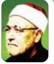
■ الشيخ محمد الغزالي - رحمه الله -