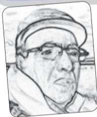
■ عمار يزلي

يسألني: نروحوا نصلوا في مسجد "التقوى" غدًا؟ الإمام يطول القراءة خير من هذا. يبقى 4 ساعات! فأسارع لأقول له لا داعي لذلك، لأن عندي دواء أخذه كل ساعة! (الدواء طبعًا هو الأكل، ما كذبش!). فكننا لا نعود إلى البيت إلا بعد أكثر من ساعتين ونصف، وتكون مصاريفي قد قامت بانتفاضة شعبية عارمة، وقطعت الطريق احتجاجًا وأحرقت البنائوات! عندما أدخل.. أذهب مسرعًا نحو الثلاجة أو الفرن، فلا أجد شيئًا فأضرب رأسي بكفي الاثنتين وأنا أقول: "يبقى وجه ربك ذو الجلال والإكرام!"