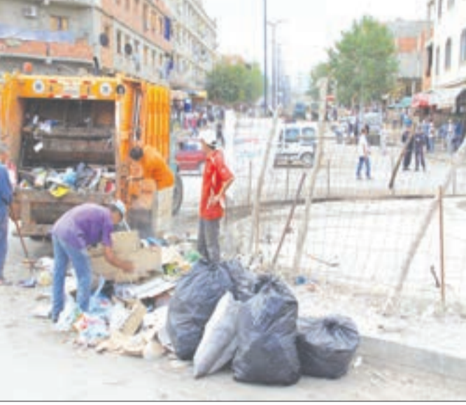
حورية - ب

غير أن بعض المواطنين لا يحترمون الأماكن المخصصة للرمي ومنهم مسيري السورشات والمؤسسات الصغيرة. ما ساهم في تراكم النفايات وتشكل النقاط السوداء. وأكد المتحدث أن شاحنات رفع النفايات تمر يوميا الساعة السابعة مساء وأحيانا تمر من ثلاث إلى أربع مرات يوميا على طريق واحد، وتتأخر في المرور على بعض الأحياء بسبب بعد مكان وجود المفرغة العمومية. مشيرا إلى أن عملية النظافة تتم بصفة يومية بجميع شوارع وأرقة البلدية وأسبوعيا يتم تحديد حي كل يوم سبت للقيام بعملية تنظيفه. هذا، وقامت البلدية بعملية تنظيف المساجد وخلال هذا الأسبوع ستباشر مصلحة النظافة والتطهير بالبلدية في تنظيف المقابر. كما تقوم لجنة الصحة بمراقبة دورية للمحلات التجارية خاصة المتعلقة ببيع اللحوم والدواجن والمواد الغذائية، وبهذا الخصوص كشف النائب فورار عن تسجيل ثلاثة تجاوزات عند محلات بيع اللحوم والأجبان، فبعد عملية المعاينة تبين أن بعض اللحوم فاسدة تنبعث منها الروائح، بالإضافة إلى ملاحظة اللجنة عملية بيع لأجبان منتهية الصلاحية. وقد تم اتخاذ الإجراءات القانونية ضد المخالفين. ومع اقتراب موسم الاصطياف تم التحضير لبرنامج تنظيف الشواطئ الثمانية المسموحة للسباحة على مستوى البلدية والذي سينفذ بعد عيد الفطر مباشرة.