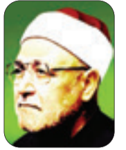
■ الشيخ محمد الغزالي - رحمه الله -