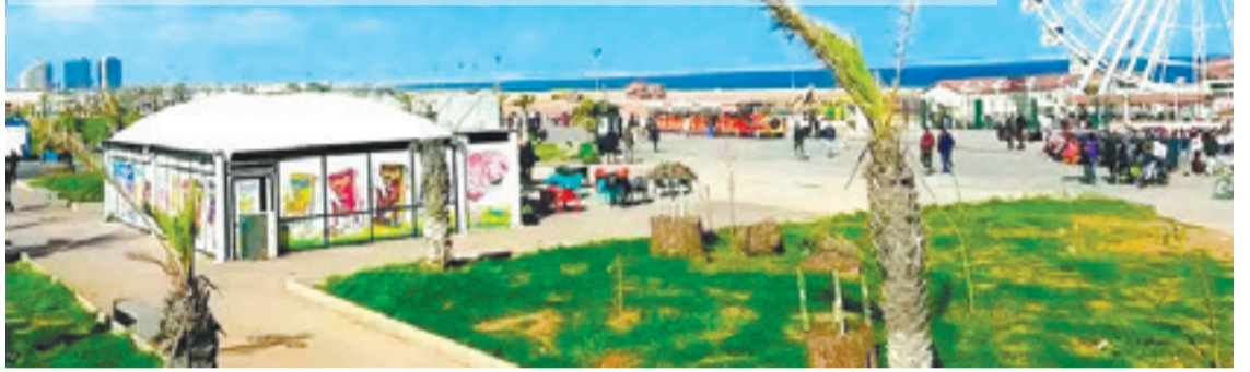
روبوورتاج: مريم زكري

اغتنمت العائلات فرصة العطلة، التي تزامنت مع عيد الفطر، للخروج من روتين الأيام العادية، والبحث عن فسحات للراحة والترفيه، خاصة بعد فتح فضاءات ومرافق جديدة وتوسع أماكن التنزه بالعاصمة، التي شهدت خلال السنوات الأخيرة تجديدا ملحوظا في مرافقها العامة. وهو ما بدأ جليا في أثناء عطلة عيد الفطر، حين استغلّت العائلات هذه التحسينات لقضاء زهرتها خارج المنزل، سواء عبر الفضاءات المفتوحة أم زيارة المتاحف والمناطق التاريخية والحدائق العمومية.