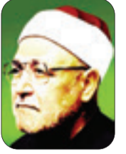
■ الشيخ: محمد الغزالي - رحمه الله -