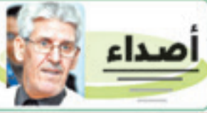
بقلم: أ. محمد الهادي الحسني