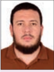
بقلم: جوزي لرجان

بينما تتوالى قرارات الدول تباعاً بحظر وسائل التواصل الاجتماعي على القاصرين، لا تزال الدول العربية تعيش حالة من السبات العميق تجاه هذا الخطر، رغم الأضرار الواضحة التي لا ينكرها عاقل، فمن المفترض أن تكون هي السبابة والقوة في حماية النشء، انطلاقاً من قيمنا وحرصنا على بناء مجتمع سليم، وحتى الآن، أقدمت ثماني دول، في مقدمتها أستراليا وماليزيا واندونيسيا، على فرض الحظر العام أو الجزئي على وسائل التواصل الاجتماعي على القاصرين، إضافة إلى العشرات من الدول التي تنوي اتباع النموذج الأسترالي في الحظر الشامل.