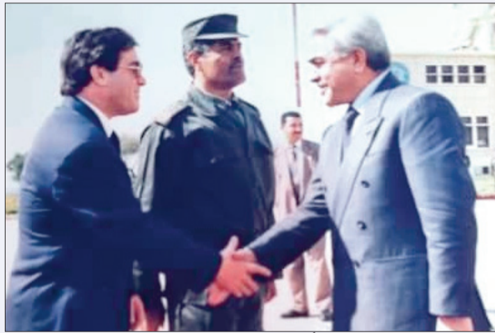
الفكر والفن والثقافة الخ...

وباعتلائه سدة الرئاسة منتخباً شرعياً واصل تنفيذ برنامجها السياسي إذ اشرف على اجراء التعديل الدستوري في 1996 والذي أحدث فيه لأول مرة الغرفة الثانية للبرلمان (مجلس الأمة) وجرى استحداث مجلس الدولة المختص بالقضاء الإداري، والأهم من ذلك حدد العهد الرئاسية في عهدتين وهو اجراء فريد من نوعه في العالم العربي والإفريقي لأن الحكم من دون قيد زمني يؤدي الى الانحراف وهو ما حدث مع المرحوم بوتفليقة عندها فتح العهدة في 2008 عن طريق البرلمان، والتبعات معروفة. وفي 23 أكتوبر 1997 أعيدت الشرعية للمجالس البلدية