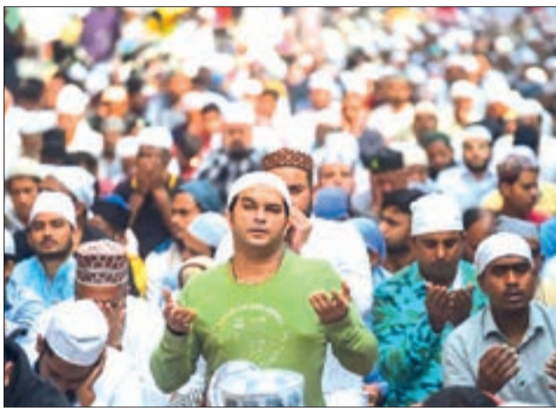
يشغل علينا ونهارنا

واجب على الأمهات أن يُعَدْنَ إلى سيرة صافية بنت عبد المطلب لينظرن كيف كانت تربّي ابنتها الزبير بن العوام، أسد الله ورسوله. الزبير الذي كان في بداية إسلامه شاباً في الخامسة عشر من عمره، فسمع يوماً بمكة أنّ النبي -عليه الصلاة والسلام- قتل، فخرج من البيت مجرّداً سيفه، حتى لقيه رسول الله -صلى الله عليه وسلم- فقال: ما شأنك يا زبير؟ قال: سمعت أنك قتلت، قال: "فما كنت صانعاً؟" قال: أردت والله أن أستعرض أهل مكة. فدعا له