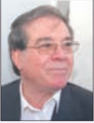
بقلم: بشير فريك

تواضع... صرامة... نظافة... مواقف... الله اكبر الله اكبر الله اكبر، ولا حول ولا قوة الا بالله، انا لله وانا اليه راجعون... تودع الجزائر ابنتها البار المجاهد، الرئيس اليامين زروال الض رحمة على روحه الطاهرة... يرحل الرجال ويبقى الذكر والابر والمواقف... فمن الصعوبة الاسترسال في الحديث عن المجاهد المناضل الرئيس اليامين زروال ونحن نودعه بألم ولوعة الى دار الخلد، الى دار البقاء الى جوار ربه ورفاقه من الشهداء والمجاهدين الذين سبقوه وحسن أولئك رفيقا... اليامين زروال أصيل عرش التمامشة المغوار الثائر وليد باتنة من أسرة متواضعة، تنسب عائلته في باتنة خطأ الى عرش بني ملول الموزع عبر ولايات باتنة وأم البواقي وخنشلة... وهو ما أكده لي عمه شخصيا المرحوم زروال بلخير.