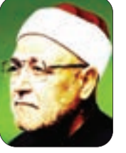
الشيخ: محمد الغزالي - رحمه الله -