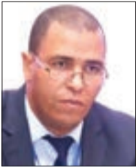
بقلم: أ. د. بوحنايم قوي أستاذ التعليم العالي جامعة ورقلة

تقف الجزائر اليوم على مفترق طرق حضاري وروحي، أرض الإسلام التي احتضنت عبر العصور حضارات متعددة وأفكارًا متلاقية. في أبريل 2026، تستعد البلاد لاستقبال البابا فرانسيس (Pope Francis)، في زيارة استثنائية تحمل رسالة إنسانية وفكرية عميقة؛ فهي ليست مجرد حدث ديني، بل تأكيد حي على دور الجزائر كجسر للتعايش والحوار بين الأديان والثقافات، ومنصة للسلام والحكمة الإنسانية. من عنابة منبت القديس أوغسطينوس إلى المعالم التاريخية المنتشرة في مختلف الولايات، تتجلى الجزائر كنموذج حي للوسطية والافتتاح الحضاري، إذ يلتقي الماضي بالحاضر، والروح بالفكر، لتصبح زيارة البابا رسالة حياة تعكس قدرة الجزائر على ربط الجسور بين الحضارات وتعزيز التلاقي بين شعوب المتوسط.