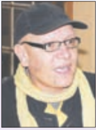
بقلم: د. عثمان عبد اللوش

لا يمكن قراءة مشهد صلاة يهود "الحريديم" أمام أسوار باب دكالة بمراكش في ربيع عام 2026 كواقعة سياحية عابرة أو مجرد ممارسة عفوية لحرية العبادة، بل هي "اللحظة الصفر" التي تتدفق فيها قرون من الهندسة السياسية والاجتماعية التي بدأت منذ عام 1666م، عندما اختار المؤسس الأول للدولة العلوية، السلطان الرشيد، أن يبدش حكمه من قلب "الملاح" بمدينة فاس، مبيتاً في بيوت أساطير المال اليهودي،