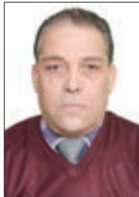
بقلم: أ. د محمد بواروايح

"إسرائيل" التي حملت ظلما اسم النبي يعقوب عليه السلام كيان غير قابل للعيش إلا في ظل الحروب، لا يخرج من حرب حتى يدخل في أخرى، يفعل الحروب ليضمن استمراره. هذه هي الحقيقة التي يحدثنا عنها القرآن الكريم: "كلما أوقدوا نارا للحرب أطفاها الله ويسعون في الأرض فسادا والله لا يحب المفسدين" (المائدة 64).