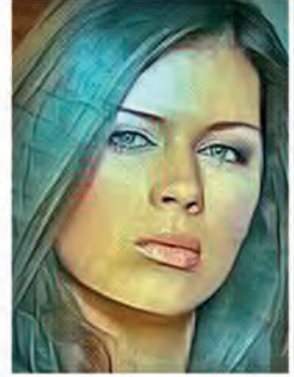
بقلم: نورهان بليدي