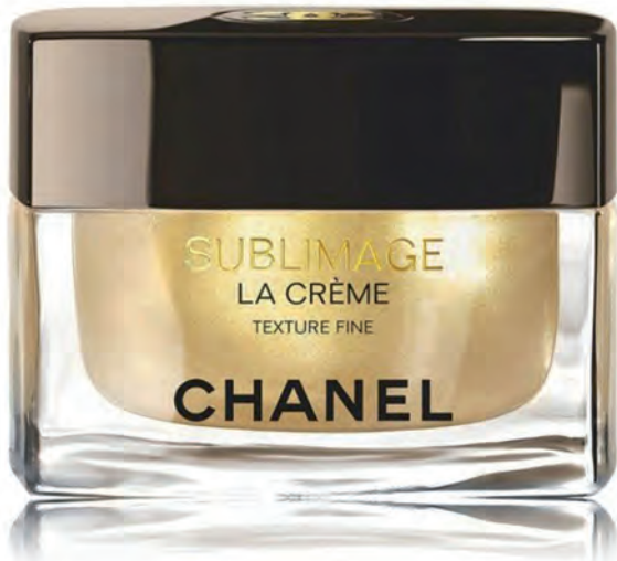
الكريم المرطب من Chanel