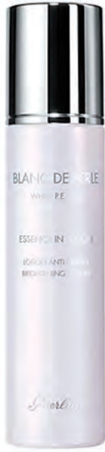
كريم تفتيح البشرة من Guerlain

بناء البشرة الصحية و النضرة شيء أساسي و لابد منه سواء بالمكياج او بدونه، و ذلك طريق العناية بها.. و لا يمكنك الاهتمام بشيء اكثر من بشرتك ، لذا جمعنا لك اقوى مستحضرات العناية بالبشرة من الماركات العالمية لعام 2017