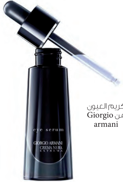
كريم العيون من Giorgio Armani