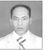
بقلم / إبراهيم الورفلي صحفى وكاتباً طرابلس / ليبيا