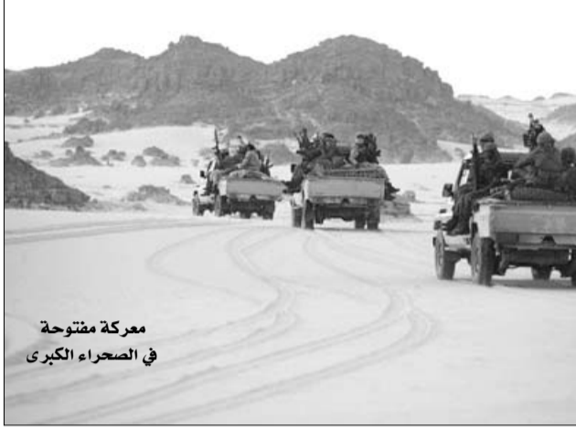
معاركة مفتوحة في الصحراء الكبرى

انطلاقا من هذه المعطيات، فإنه يصبح من المستبعد أن تكون مجموعة تابعة للتنظيم الإرهابي قد تنقلت لتنفيذ الاختطاف. لأنها مخاطرة قد تنتهي بالدخول في مواجهة مع السكان، مما يرجح أن تكون العملية من تنظيم عصابة