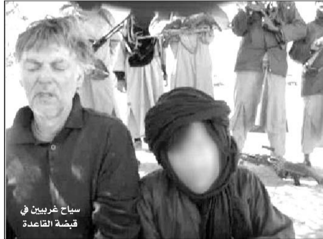
سياح غربيين في قبضة القاعدة

وأوضحت وزارة الخارجية النيجرية، في بيان أوردته التلفزيون الرسمي النيجري، بأنه "في 20 أبريل 2010، اختطف مجموعة مسلحة غير محددة فرنسيا وجزائريا كانا يتنقلان في سيارة بالمنطقة المحاذية لكل من مالي والجزائر"، ما يعني أن الرهينتين خلفتا يوم الثلاثاء وليس الخميس، كما أوردته جهات إعلامية ورسمية فرنسية. وقالت مصادر على صلة بملف الاختطافات في منطقة الساحل والصحراء، إن المواطن الفرنسي المختطف سائح عمره أكثر من