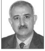
بقلم: محمد أرزوقي فراد

صدر سنة 1847م، وتحدث المؤلفان فيه عن قضية صراعات الصوف في آث يعلى.