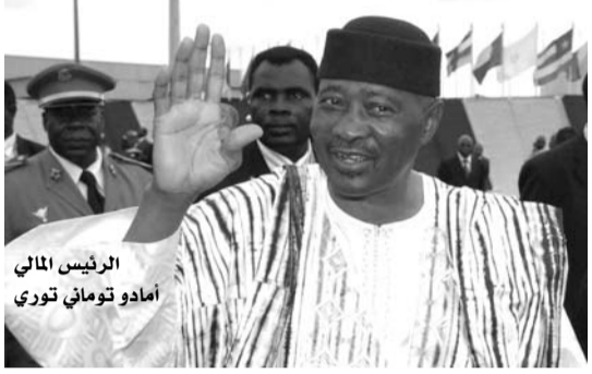
الرئيس المالي أمادو توماني توري

"كيف كان الفرنسيون سيتعاملون مع رعايانا لو قتل الفرنسي كامات على يد القاعدة؟"