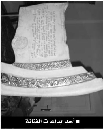
أحد إبداعات الضائفة

من ثانية عمر راسم استقرت في بيروت بعد الزواج، لكن ظروف الحرب اللبنانية في 1975 اضطرتها إلى العودة مرة أخرى إلى باريس، وهناك استقرت لمدة 3 سنوات، وهي الفترة التي واجهت فيها الفراغ الذي رأت انه من الأفضل لها أن تستغله في تنمية موهبة الرسم لديها، فدخلت مدرسة متخصصة في كان، وهناك أخذت المبادئ الأساسية ومارست الفن كهواية، فإذا بالهواية تصير إدمانا وحاجة ملحة، تقول عن هذه الفترة: «بعد عودتي إلى بيروت لم استطع التوقف عن ممارسة الرسم، ففتحت رفقة أستاذ متخصص مدرسة كنا نقدم فيها دروسا في الرسم، في البداية كنت أرسم فقط