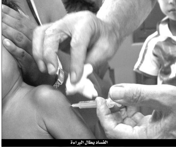
الفساد يطال البراءة

أجلت أمس محكمة سيدي امحمد بالعاصمة النظر في فضيحة «اللقاحات الفاسدة بمعهد باستور» إلى نهاية الشهر الحالي لاستدعاء الشهود.