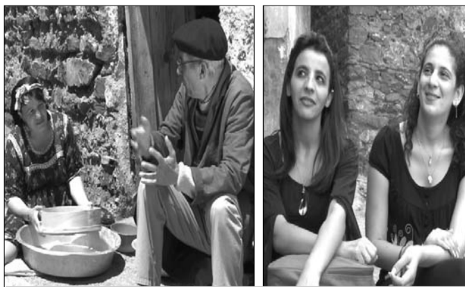
مشهدان من السلسلة

أنهي علي موزاوي منذ أيام قليلة تركيب سلسلته التلفزيونية «تيري نتمزي»، أوجب الشباب، المزمع عرضها خلال شهر رمضان على القناة الأمازيغية. وتتكون السلسلة من 22 حلقة ذات 35 دقيقة، وتعالج مشاكل الشباب في منطقة القبائل بين تجاذبات الواقع وأحلام الهجرة. السلسلة ذات طابع اجتماعي بحث تسلط الضوء على الواقع اليومي لهذه الفئة التي تواجه أحلام الحرقفة، الهجرة، الحب