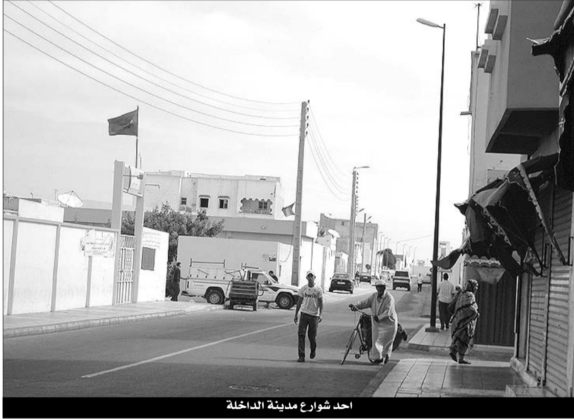
أحد شوارع مدينة الداخلة