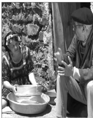
مشهدان من السلسلة

وفي السياق ذاته ترك البيان لأبناء بلدية برج بونعامة الحرية في المشاركة في إحياء ذكرى الشهيد العقيد جيلالي بونعامة يومي 5 و6 أوت، لكنه ركز على مقاطعة مجاهدي الولاية لهذه الذكرى «ولأننا اليوم على أبواب ذكرى من أهم ذكريات هذه الولاية ألا وهي ذكرى استشهاد العقيد جيلالي بونعامة التي تحيا في مسقط رأسه بلدية برج بونعامة يومي 5 و6 أوت، وإذا