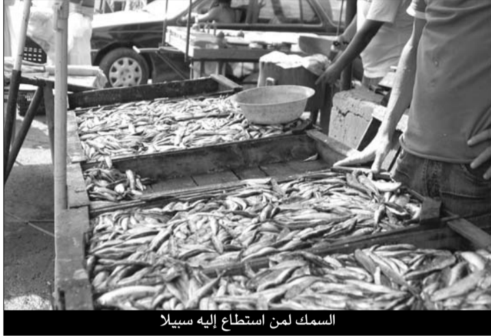
السمك لمن استطاع إليه سبيلا

ويلج سعر السمك ذروته بموانئ الوسط على غرار ميناء بوهارون بتيبازة وموانئ بومرداس، حيث يتراوح بين 300 دج و400 دج للكيلوغرام الواحد، بينما لا يقل عن 350 دج للكيلوغرام بموانئ الغرب الجزائري،