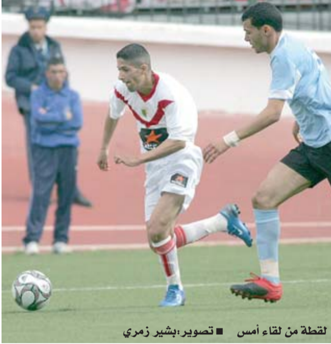
لقطة من لقاء أمس ■ تصوير: بشير زمري

لعب، قبل أن ينفذ أوسري مرماه من هدف محقق بعد قذفة أيمن العازم.