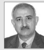
بقلم: محمد أرزوقي فرداد

ذكرت المصادر التاريخية أن المرأة القبائلية كانت تشارك في الحروب الثأرية التي تندلع بين الصفوف (الأحلاف) المتحاربة، لمناصرة صفها عن طريق الهاب حماس المقاتلين بالكلمات المؤثرة، والصياح، ومداداة الجرحى. وكان وجودها في الخطوط الخلفية يحول دون تراجع المقاتلين خوفا من العار، لأن النسوة كن يؤشرن بمادة الضخم على ظهور الهاربين من ساحة المعركة لتضخم لدى أهل القرية.