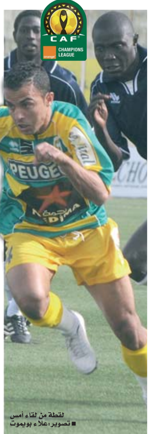
لقطة من لقاء أمس

وستواجه شبيبة القبائل في الدور القادم النادي الإفريقي التونسي الذي تأهل بدوره على حساب فريق ساحل النيجر، وستواصل شبيبة القبائل استقبال منافسيها في المنافسات القارية على أرضية أول نوفمبر بتيزي وزو وهو ما أكده رئيس الشبيبة محند شريف حناشي للشروق.