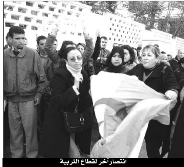
انتصار آخر لقطاع التربية

التربية الوطنية أن يسجل نقاطا إضافية في جدول الأعمال الذي يحدده رئيس اللجنة الوطنية، ويتم إشعار الوزير ثمانية أيام على الأقل قبل انعقاد الاجتماع، وترفع كل محاضر الاجتماعات لوزير القطاع والنقابات المعتمدة كوثيقة للإعلام، وتجتمع اللجنة برؤساء اللجان الولائية للخدمات الاجتماعية، كل سنتين، بهدف تقييم تنفيذ برنامج العمل الوطني. واقترح مضمون القرار أن يحدد تاريخ 30 نوفمبر لضبط مشروع ميزانية التسيير السنوي للخدمات الاجتماعية ذات الطابع الوطني طبقا للبرنامج السنوي، ويصادق على الميزانية قبل 15 فيفري من السنة المالية وتسلمها لهيكل التسيير المركزي قصد تنفيذها، وتحدد الاختصاصات مسبقا لجميع الاحتياجات ويحدد كذلك صفة "المستفيدين" من المصنفين ضمن "الأسر التي يتكفلون بها طبقا للتنظيم الساري المفعول والمشار إليه في صلب النص