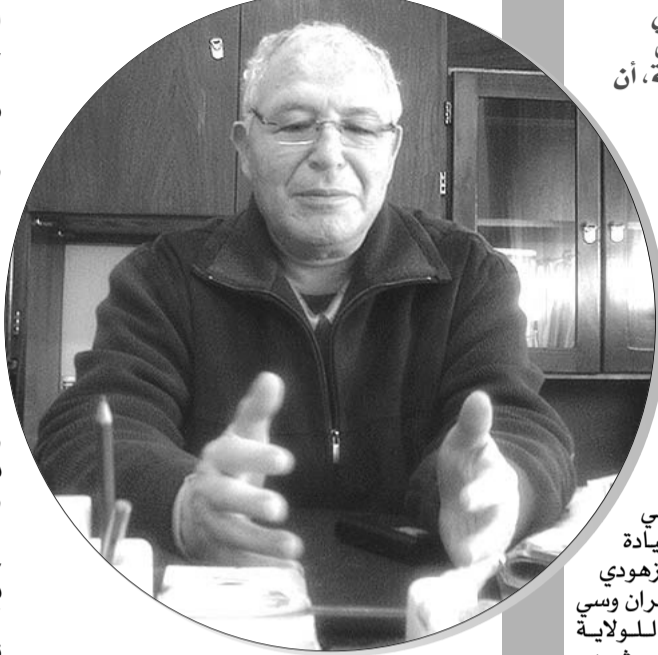
أيام غير رأيه وطالب