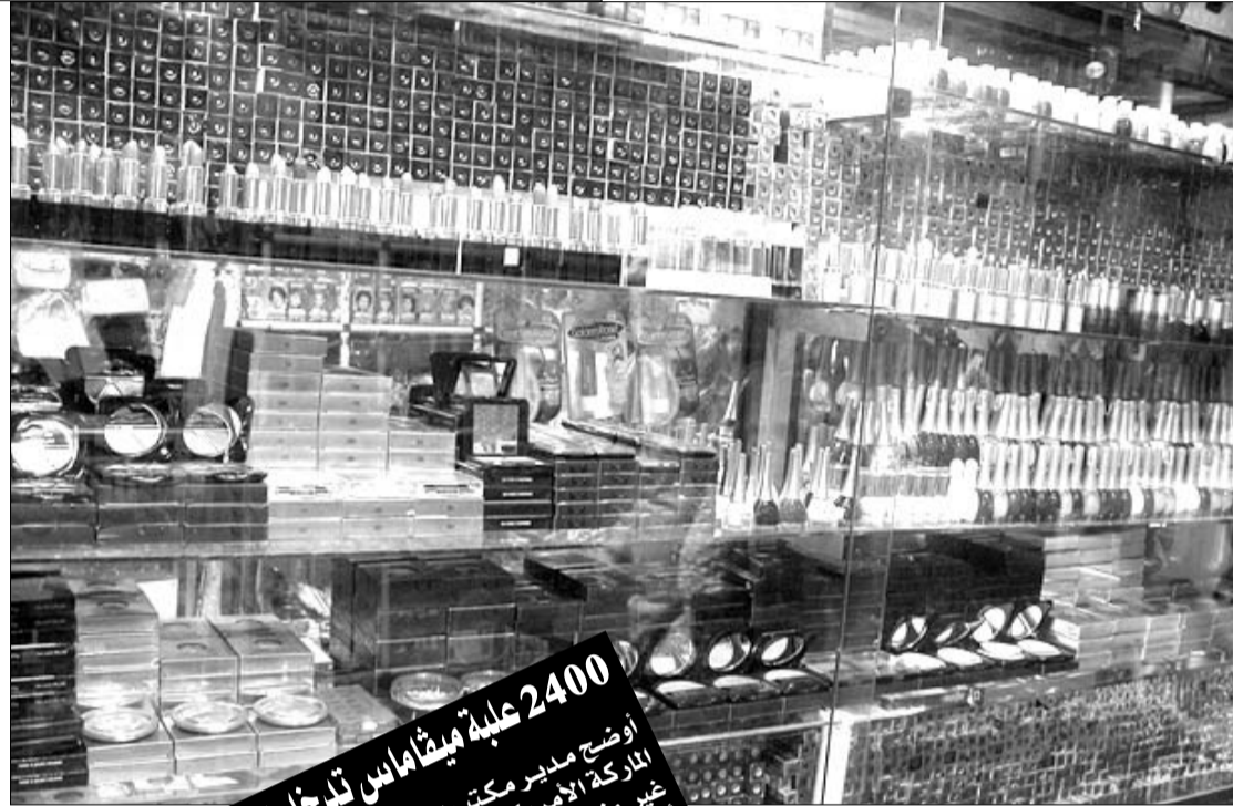
ماكياج خطر على صحة الجزائريين

ووفقا لهذه التقارير احتلت مواد التجميل والمنتجات التجميلية الأخرى كالعطور والصابون المرتبة الأولى على قائمة المنتجات المحتجزة في السوق الجزائرية بما قيمته 30,86 بالمائة لعام 2009 من مجموع السلع المحتجزة، وتشير التقارير المطلع عليها أن الظاهرة أخذت أبعادا خطيرة في الجزائر، حيث تم إحصاء ما لا يقل عن 238 نوع من مختلف أنواع مواد التجميل في مقدمتهم (الماكياج)،