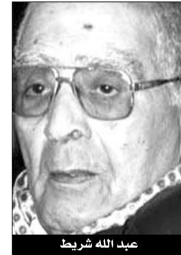
عبد الله شريط

كشفت بثينة شريط، نجلة المفكر عبد الله شريط، في لقاء مع «الشروق»، عن أهم القضايا التي كانت محل خلاف بين الراحل وأهم رجال السياسة، على غرار الرئيس أحمد بن بلة، وكذا موقفه من اللغة العربية، مروراً بوفاته والالتفاتة الطبية التي حظيت بها عائلته من طرف رئيس الجمهورية عبد العزيز بوتفليقة.