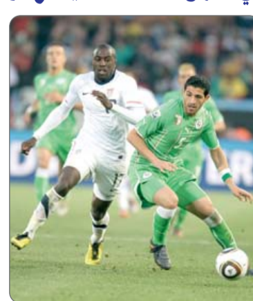
لاعب هو اللعب بانتظام وانتزاع مكانة دائمة في التشكيلة الأساسية.. أدرك جيدا أن مهمتي لن تكون سهلة، لأنني أتنافس

وقال مدافع بنفيكا السابق لموقع فولهام الرسمي، إن هدفه الرئيسي هو انتزاع مكانة أساسية واللعب بانتظام: "هدف أي لاعب هو اللعب بانتظام وانتزاع مكانة دائمة في التشكيلة الأساسية.. أدرك جيدا أن مهمتي لن تكون سهلة، لأنني أتنافس