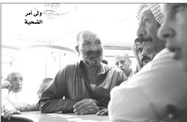
ولي أمر الضحية