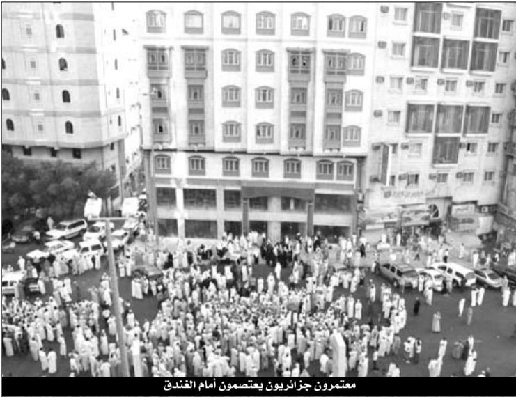
معتصرون جزائريون يمتصون أمام الفندق

العالمية الناطقة بالانجليزية ومنها موقع الفويسس الذي نقل صورة الضحية أثناء ارتطامها بسطح الفندق المجاور وقال إن الطفلة الضحية بعد أن هوت من الطابق العلوي للفندق الذي تقيم فيه سقطت على سطح فندق مجاور على رأس عاملين بنغاليين أيضا فأصابتهما بجروح.. وفتحت مواقع اسكندنافية مشهورة بعدائها للمسلمين لزوارها المجال لمهاجمة المسلمين بأبشع الأوصاف بينما لم تعر الصحافة الفرنسية أي اهتمام للحادثة رغم أن الضحية تقطن في فرنسا وسافرت عبر الخطوط الجوية الفرنسية.