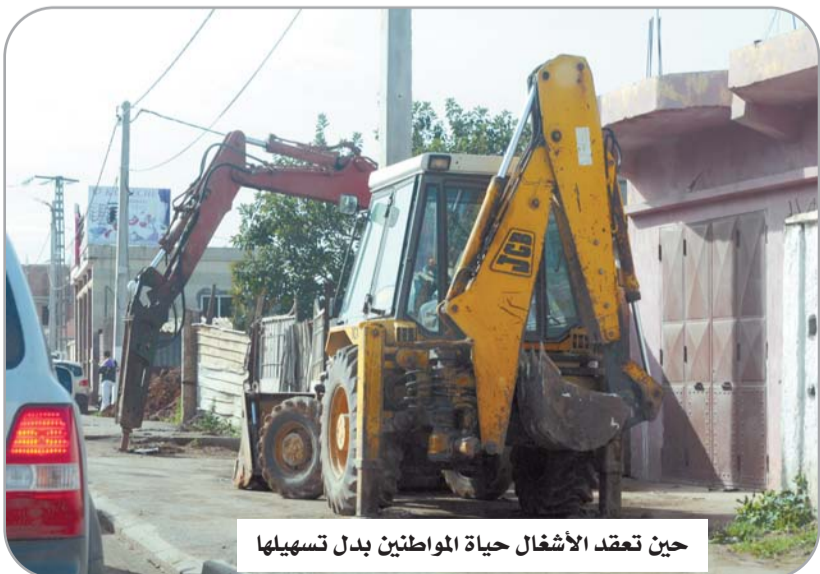
حين تعقد الأشغال حياة المواطنين بدل تسهيلات