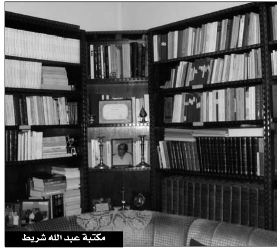
مكتبة عبد الله شريط

• بوتفليقة أدى الواجب في وفاة والدي غير أن وزارتي المجاهدين والتعليم العالي تجاهلتها