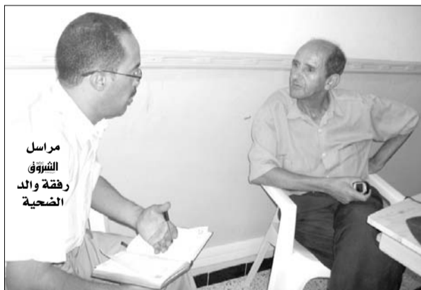
مراسل الشروق رفقة والد الضحية

أنا من طلبت من صديقي التكلّم بتربيتها في فرنسا، وكأنت دائمة الاتصال بي