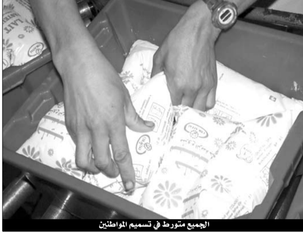
الجمع متورط في تسميم المواطنين

عملية السطو، وطالب دفاعهما بتبرئة ساحتهما، فإن التجار 3 المتهمين في الفضيحة، صرحوا بأنهم لم يكونوا على علم بأن الحليب الذين سقوه ملك لرجل أعمال استورده من الأرجنتين عبر ميناء وهران، وتم حجزه وتخزينه بميناء السانية الجاف، كما أن علب الحليب التي باعها تحمل تاريخا لا يبين انتهاء صلاحيتها، وأنها قابلة للاستهلاك إلى غاية ماي 2011، هذا وتركزت شهادة الشهود الذين استقدموا إلى جلسة المحاكمة، بينهم مسؤولون في جهاز الجمارك، على الإجراءات التي تقتضيها عملية إخراج الحاويات من الميناء، كما أشاروا كذلك إلى تقصير حراس هذه المنشأة في تأمين البضائع المحجوزة، وأمام هذه المعطيات الخطيرة، التمس وكيل الجمهورية لدى محكمة الجناح، تسليط أقصى عقوبة على المتهمين الستة، التي قد تصل إلى 10 سنوات سجنا نافذا.