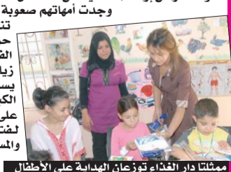
مشغلتا دار الغذاء توزعان الهدايا على الأطفال