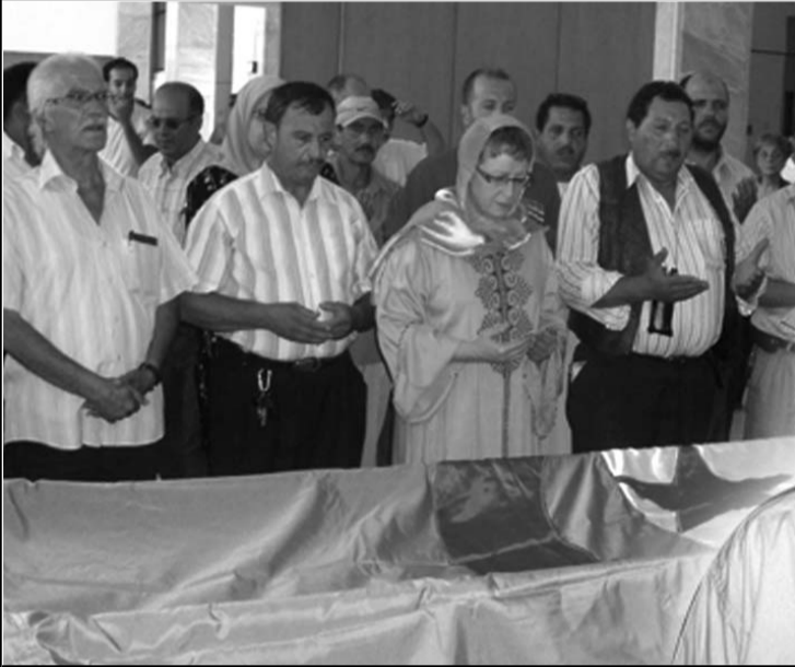
يرحل البشر ويبقى الأثر