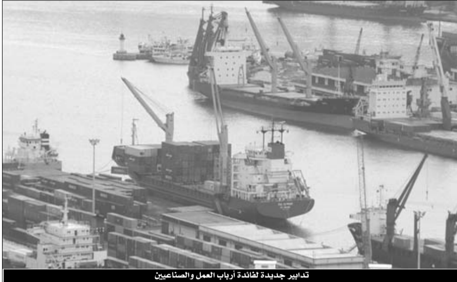
تدابير جديدة لضبط أرباب العمل والصناعيين

يُعطى بمعية أعمال الطباعة والإصدار من الرسم على القيمة المضافة