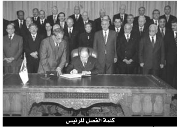
كلمة الفصل للرئيس

صدره بأمرية رئاسية، تعفيه من ضرورة موافقة أعضاء البرلمان عليه، على خلفية أن الأمرية ستصدر بعد اختتام الدورة الربيعية المقرر يوم الخميس المقبل، ولا يستعد أن يستدعي الرئيس وزراء الحكومة للاجتماع في مجلس للوزراء قبل يوم الأحد المقبل.