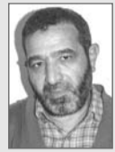
بقلم: حبيب راشدين

مدرسة بن بوزيد لم يرضها قتل مالك وواد زينة، حتى شهد لها المجتمع الاستفادة بالجدوى والنجاعة في تحقيق الغلبة لثون النسوة، وهي تقطع أشواطاً بلغت نقطة الراجوع في ما اعتقد أنها سياسة دبرت لبيل، ونفذت خارج رقابة وحراسة البرلمان النائم، لتأنيث المجتمع عبر تأنيث الجامعة الحاضنة الطبيعية للطبقة الوسطى، التي سوف تكون الغلبة فيها لتاء التأنيث، بكل ما تعد به هذه السياسة من انقلاب سوسولوجي، ورجفة في العلاقات بين الجنسين، لا يأمن أحد ما تخفيه من رادفات مدمرة.