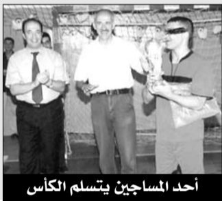
أحد المساجين يتسلم الكأس

توج منتخب مساجين سلوفينيا بكأس العالم لهذه الفئة التي نظمت من طرف جمعية أولاد الرحومة تحت الرعاية السامية لوزير العدل حافظ الأختام وبمساهمة المديرية العامة للسجون ومديرية الشباب والرياضة لولاية الجزائر، وذلك أمام منتخب الولايات المتحدة 5-4 للعلم فإن الدورة جرت بالقاعة متعددة الرياضات بالأبيار بين 9 و11 جويلية الجاري.