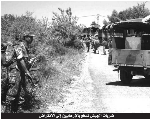
ضربات الجيش تدفع بالإرهابيين إلى الانقراض

للالتحاق بصوف الإرهابيين، غير أن الأمن وبعد تركيزه على معاقل الجماعات وتضييق الخناق عليها استطاع الإطاحة بعدد كبير منهم وصل إلى أكثر من 20 عنصرا آخرهم الخمسة الذين تم القضاء عليهم مباشرة بعد العملية الانتحارية على مقر الدرك الوطني بعمال.