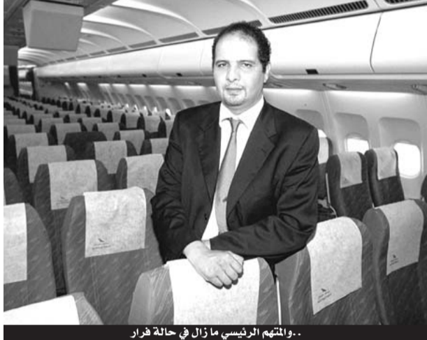
.. والمتهم الرئيسي مازال في حالة فرار

أفراج مجلس قضاء البليدة عن حوالي 15 متهما في قضية الخليفة التي اعتبرت أكبر قضية فساد في البلاد، ضمت 104 متهم، بينهم 11 متهما في حالة فرار إلى يومنا، بمن فيهم رفيق عبد المومن خليفة المتهم الرئيسي في الفضيحة، وتمت تبرئة 49 متهما من إجمالي 104 المتابعين في هذه القضية، وإدانة 55 متهما، وتم حاليا الإفراج عن المتهمين الـ 15 بعد أن قضى هؤلاء العقوبة التي أصدرتها ضدهم محكمة الجنائيات في مارس 2007.