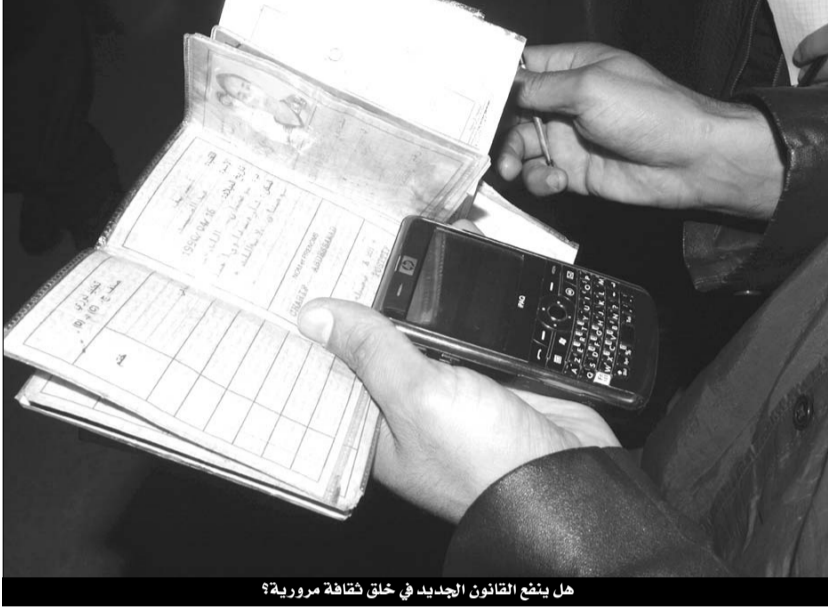
هل ينفع القانون الجديد في خلق ثقافة مرورية؟

وهو الأمر الذي يعني أن الأسلوب الردعي الذي اتخذته الحكومة تجاه الجزائريين من