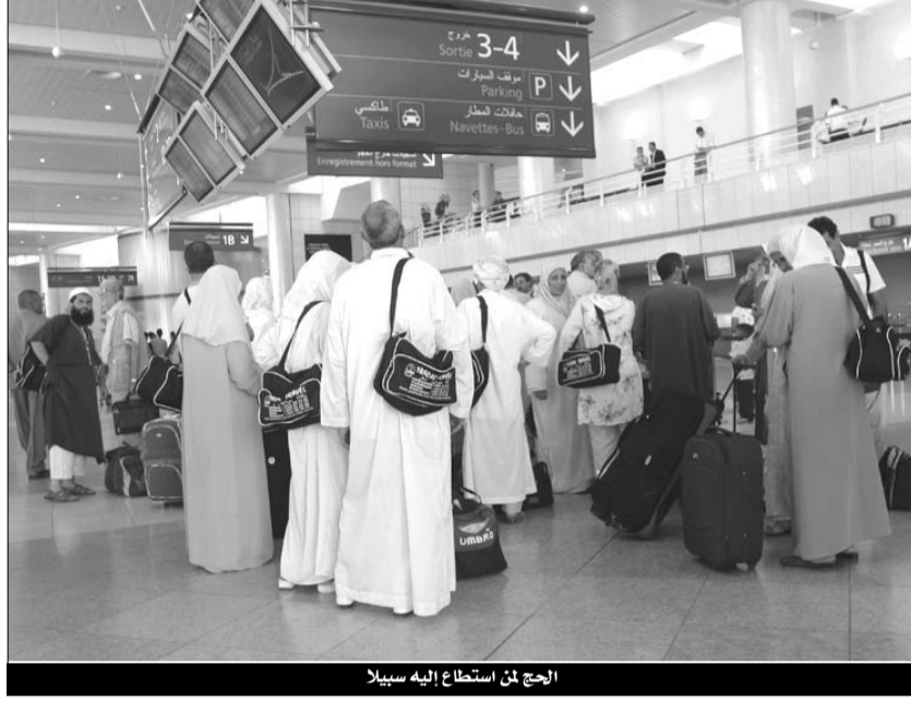
الحج من استطاع إليه سبيلا

وكشفت أمس، مصادر مقربة من مجلس إدارة الديوان الوطني للحج والعمرة أن دفتر الشروط الخاص بالوكالات السياحية الخاصة الراضية في تأطير موسم حج 2010/1431 بالشراكة مع الديوان الوطني للسياحة والأسفار و"تورينغ" سياحة وأسفار الجزائر سيكون جاهزا خلال الأيام القادمة إلا أن الوكالات السياحية الخاصة ستكون تحت الإشراف المباشر لهيئتين السياحيين السابقين الذكر حسب ما نصت عليه التعليمات الأخيرة للوزير الأول لتتظلم موسم الحج، حيث تستفيد الوكالات السياحية الخاصة الفائزة بشرف تأطير 14 ألف حاج إلى جانب الديوان الوطني للسياحة والأسفار و"تورينغ" وكذا الديوان الوطني للحج والعمرة