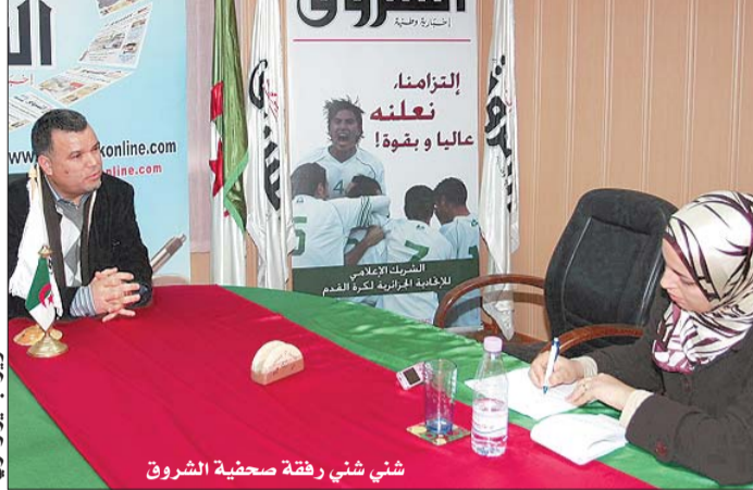
شني شني رفقة صحفية الشروق