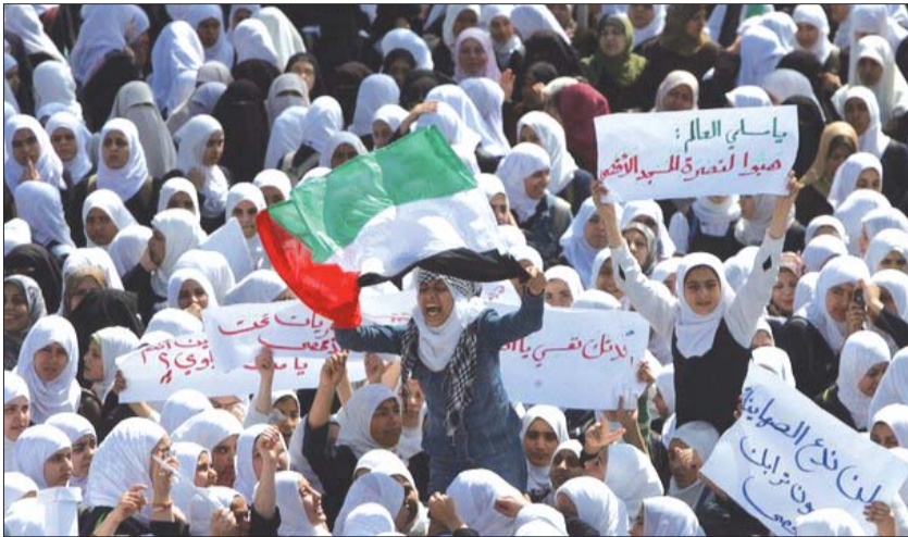
الأراضي المحتلة: مكتب الشروق

تواصلت أمس حالة الغليان في مختلف أرجاء المدينة المقدسة عقب إصابة واعتقال عشرات المواطنين خلال المواجهات المتواصلة بين الشبان وقوات الاحتلال التي استخدمت الرصاص الحي والمطاطي وقنابل الغاز، وذلك بالتزامن مع تنفيذ إضراب تجاري جزئي استجابة لدعوة القوى والفعاليات الوطنية والإسلامية الفلسطينية احتجاجاً على حصار البلدة القديمة والمسجد الأقصى المبارك بصورة غير مسبوقة.