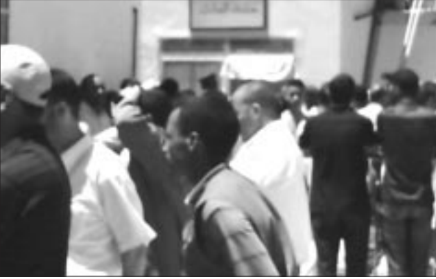
قائمة الضحايا :