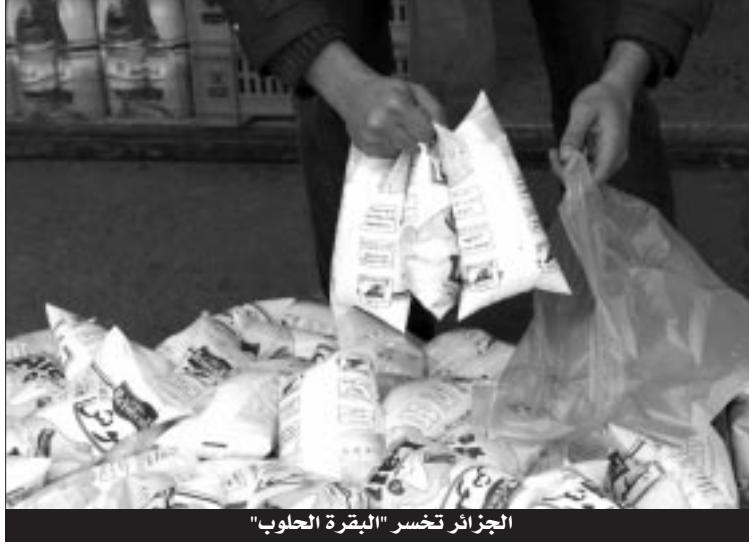
الجزائر تخسر "البقرة الحلوب"

وأكد زياتي أن "المنتجين مطالبون بدفع مقابل للمربي، ودفع تكاليف الرقابة البيطرية للأبقار، قبل شراء الحليب منه، مما يجعل الدعم المقدر بـ 2 دينار قليل جدا، ولا يغطي نفقات شراء الحليب من المربين ولا حتى نفقات المربين أنفسهم، كما أن إنتاج حليب الأبقار في الجزائر ضعيف جدا، مما يجعله نادر والحصول لا يغطي حتى 7 بالمائة من حاجيات المنتجين، عكس غبرة الحليب المستوردة المتوفرة لدى الديوان الوطني للحليب