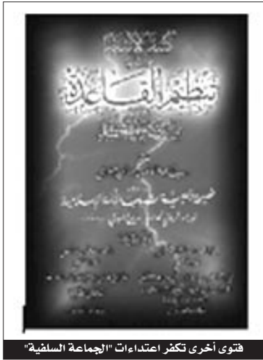
فتوى أخرى تكشف اعتداءات "الجماعة السلفية"

وحمل الشيخ البطوش تنظيم "القاعدة" وأتباعه مسؤولية المشاكل التي تعاني منها الأمة الإسلامية بالقول "أن القاعدة، أعطت الذريعة للجهات المتنوعة لتشويه